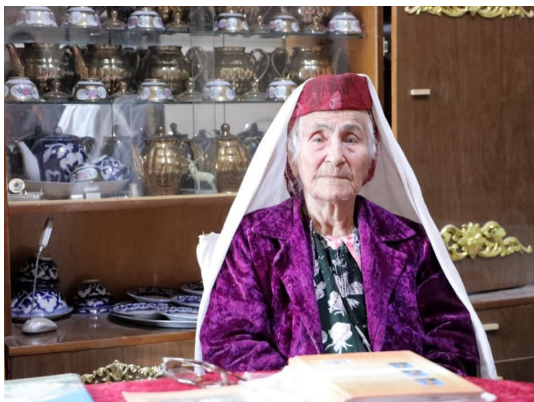
Бадашчи Адолат момо